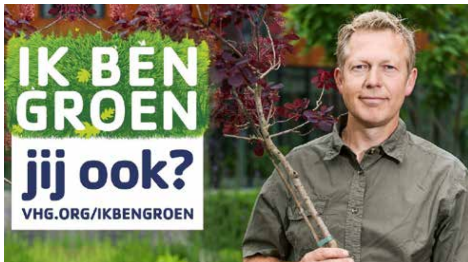
VHG lanceerde enkele jaren geleden de arbeidsmarktcampagne 'Ik ben groen, jij ook?', die een aanzuigende werking had op potentiële zij-instromers.

Hoewel zij-instromers met twee rechterhanden en liefde voor tuinieren in het voordeel zijn, voegt Zijlmans daaraan toe dat het ontbreken van deze twee competenties een succesvolle switch naar de groene sector niet in de weg hoeft te staan. 'Een traditionele leerling-hovenier kon vroeger met gereedschappen en planten overweg; voor de huidige generatie zij-instromers geldt dat lang niet altijd. Wat niet wil zeggen dat je niet kunt slagen. Waar je vroeger met zakken cement van 50 kilo rondsjouwde, is het vak nu minder zwaar geworden. De basis wordt gevormd door enthousiasme en motivatie. Daarnaast bestaat bijna de helft van de leerlingen bij ons uit vrouwen. Dat beeld zie je totaal niet terug in de sector zelf. We merken ook dat de interesse in parttime werken onder zij-instromers groot is. Kortom, er dienen zich nogal wat veranderingen aan op de arbeidsmarkt waarop je als groenbedrijf zult moeten anticiperen.'