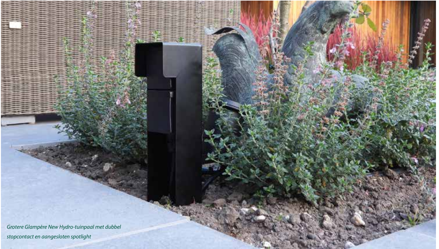
Grotere Glampère New Hydro-tuinpaal met dubbel stopcontact en aangesloten spotlight

gebied van elektriciteit. In samenspraak met de hovenier en de opdrachtgever wordt er een verlichtingsplan gemaakt, dat naar behoefte wordt ingevuld. 'We stemmen met elkaar af wat het mooiste is, wat van deze tijd is en wat gebruikelijk is. Meestal proberen we voor de uitstraling diepte in de tuin te creëren, door achter in de tuin licht te plaatsen en aan de zijkanten objecten of borders uit te lichten. Wanneer de hovenier het beregeningsplan af heeft, leggen we de bekabeling met die route mee. Dan hoeft