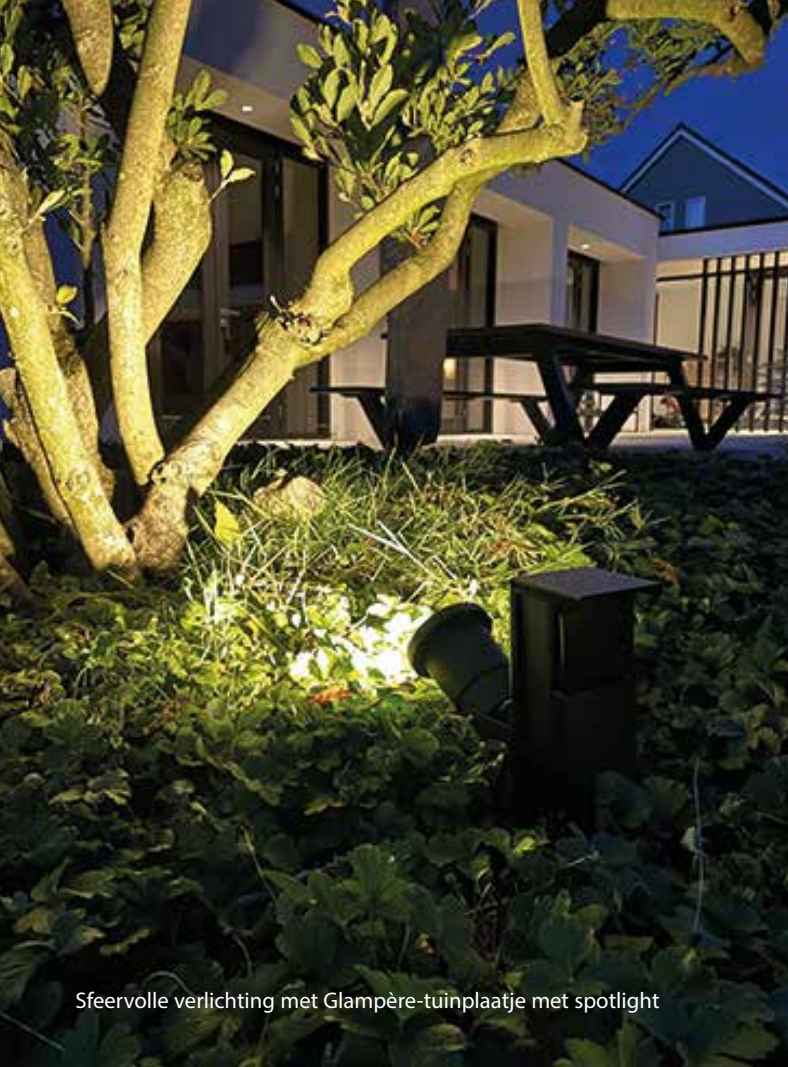
Sfeervolle verlichting met Glampère-tuinplaatje met spotlight