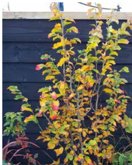
Parrotia persica , meerstam

Door de vraag naar wintergroen is verder laurier in opmars. ‘Voor het mooie groene blad. Hij is bovendien ook leverbaar als leiboom.’ Ook de horizontale variant van de leibomen, de dakbomen, doen het goed. Deze groeien dankzij