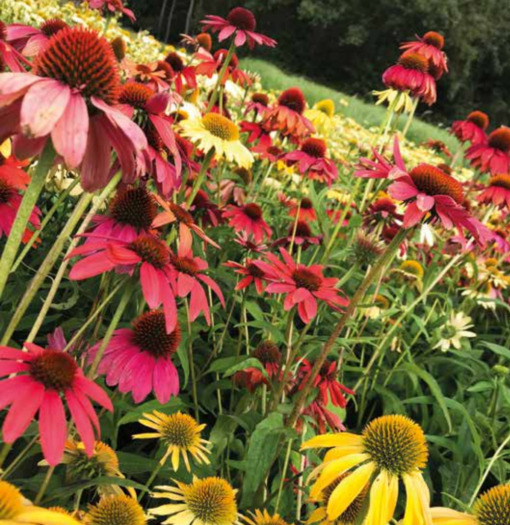
Vlinderlokkende vaste planten