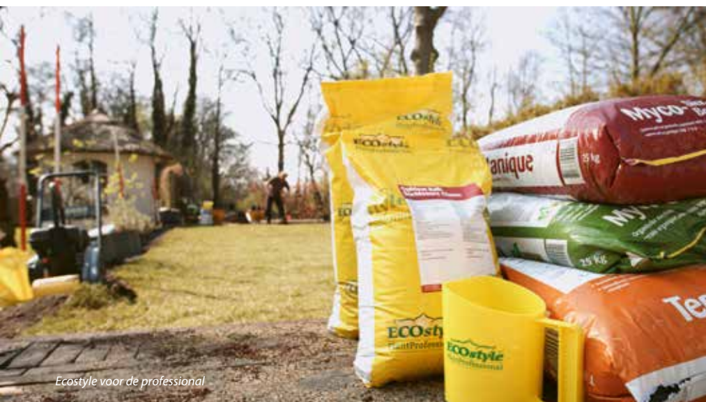
Ecostyle voor de professional

www.vakbladdehovenier.nl/article/31874/wesseling-tuinen-werkt-al-jaren-met-ecostyle