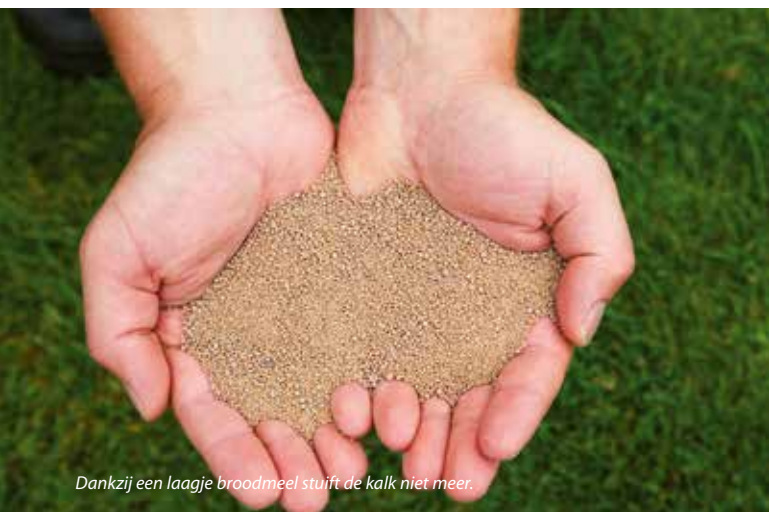
Dankzij een laagje broodmeel stuift de kalk niet meer.