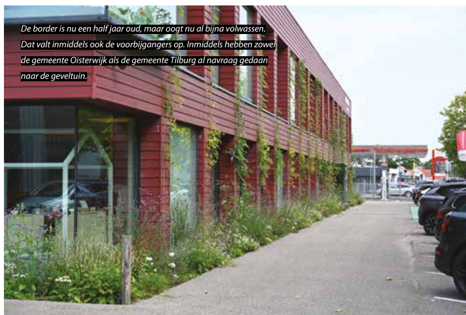
De border is nu een half jaar oud, maar oogt nu al bijna volwassen. Dat valt inmiddels ook de voorbijgangers op. Inmiddels hebben zowel de gemeente Oosterwijk als de gemeente Tilburg al navraag gedaan naar de geveltuin.