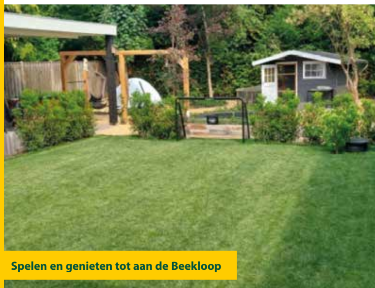
Spelen en genieten tot aan de Beekloop

De eindstage van Lisanne Walles-Coumans aan de OntwerpAcademie resulteerde in deze tuin, die perfect bij de bewoners past. Zoals ze zelf omschreef in de inzending: een huis waarbij een aanbouw, overkapping en verhoogd loopgedeelte zorgen voor dominante lijnen. Daar passen rechthoekige vormen goed bij. In het ontwerp laat Lisanne de rechthoekige vormen bij het huis overgaan in rondere vormen en natuurlijke beplanting, achter in de tuin – als uitnodiging om de tuin in te gaan, waar wat te ontdekken is en mens en natuur elkaar ontmoeten! In en rond de aflopende achtertuin staan veel bomen en struiken. Daar liep vroeger de Beekloop, een van de stroompjes die water afvoerden vanaf de weilanden rond het oude centrum van Geldrop naar het riviertje de Kleine Dommel. Na het loungeterras heeft Lisanne een soort overgangsgebied gecreëerd naar meer natuur, passend bij het beekdal dat daar vroeger lag. In dat overgangsgebied staat inheemse oever- en bosbeplanting, een inheemse meerstammige struik (bloesem in het voorjaar, herfstkleur in het najaar) en loopt een paadje met stapstenen door de schaduwrijke plekken tussen bomen, struiken en rondom het tuinhuis.