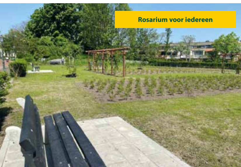
Rosarium voor iedereen

Aannemingsbedrijf Van der Meer BV legde in Leiderdorp in opdracht van de gemeente een rosarium aan. Bij de aanleg van dit rosarium is gekozen voor het toepassen van verschillende rozen en diverse bloemenmengsels, waardoor de biodiversiteit wordt vergroot. Deze diversiteit heeft een positieve invloed op het aantrekken van verschillende soorten bestuivers voor de ondersteuning van de populaties. Ook zorgt de variatie aan planten voor een betere bodemstructuur en -gezondheid. Daarnaast waren groenherstel en omvorming belangrijke doelen. Bomen en planten absorberen immers CO 2 uit de atmosfeer en dragen daarmee bij aan het verminderen van broeikasgassen. Bovendien heeft de aanleg van het rosarium een positief effect op de gezondheid en het welzijn van mensen. De groene omgeving biedt een nieuwe plek voor ontspanning.