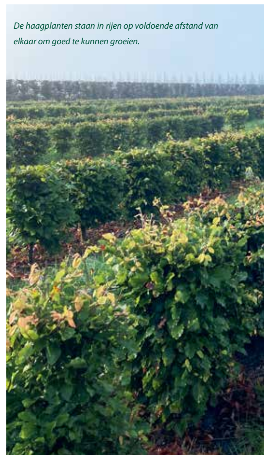
De haagplanten staan in rijen op voldoende afstand van elkaar om goed te kunnen groeien.