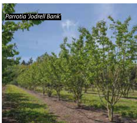
Parrotia 'Jodrell Bank'