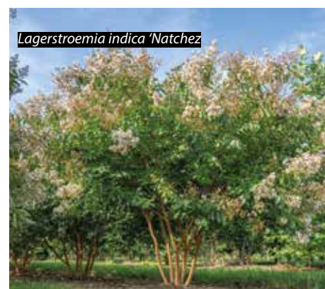
Lagerstroemia indica 'Natchez'