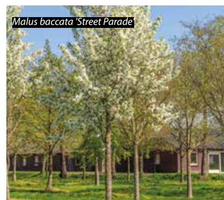
Malus baccata 'Street Parade'