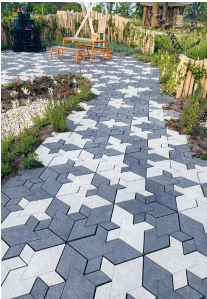
De tegels van Studio Wae op de Floriade geven een speels effect.