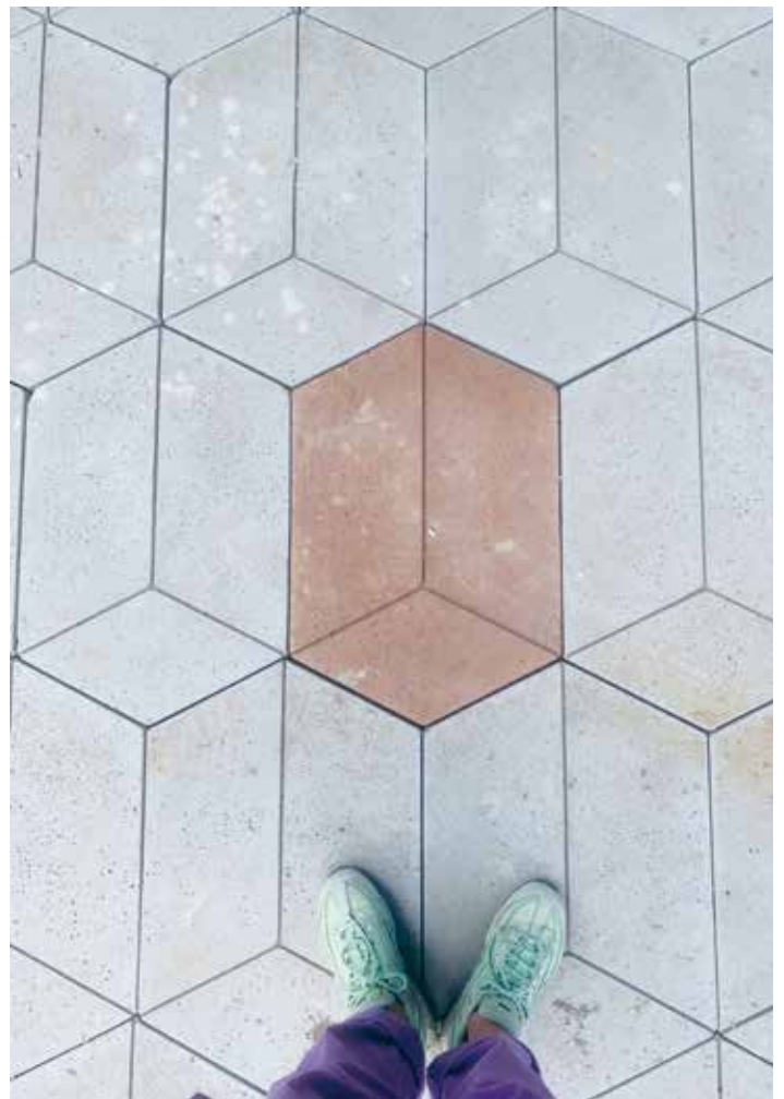
Studio Wae maakte een nieuwe tegel, The Box, die nu bij studentenwoningen in Utrecht ligt.