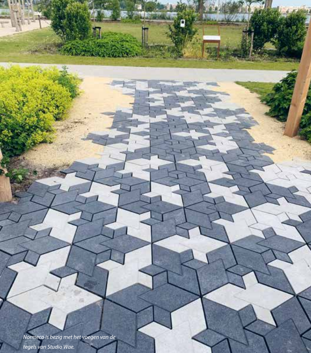
Normeco is bezig met het voegen van de tegels van Studio Wae.