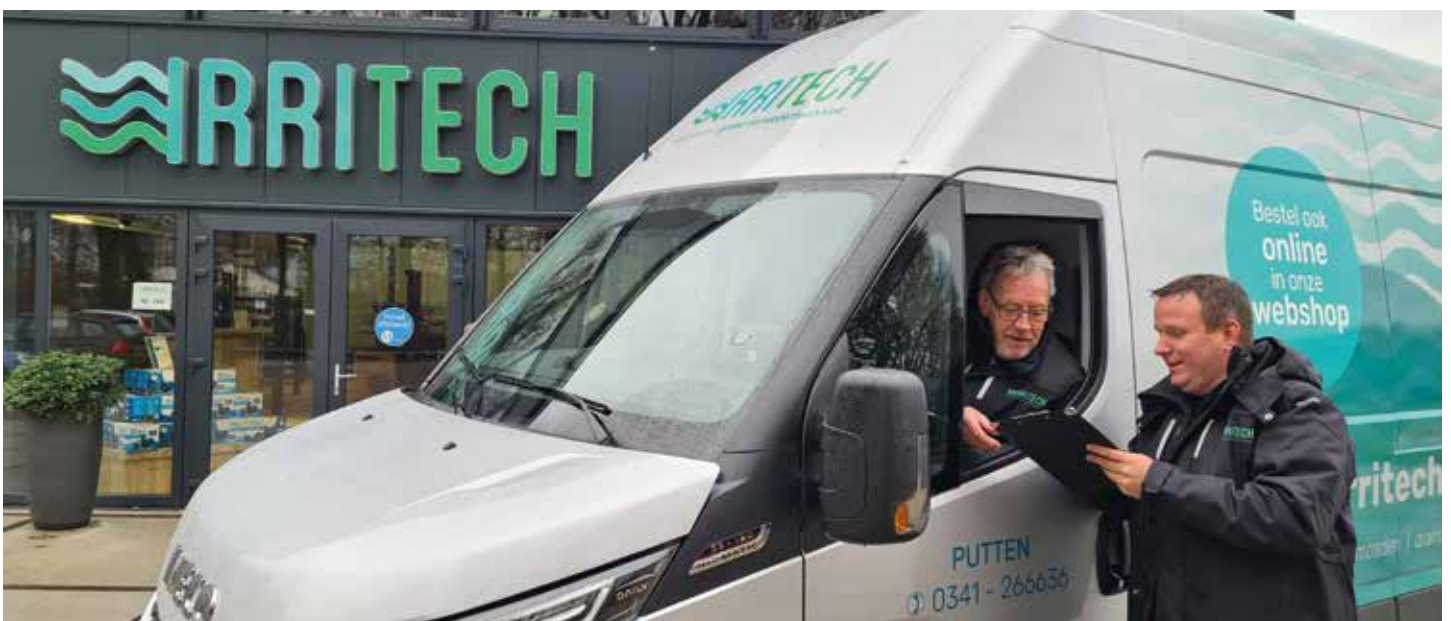
De eigen bezorgdienst levert ook goederen af op werklocaties.

Welke producten van pas komen voor het onderhouden van de waterkwaliteit, hangt deels af van het type vijver en de toestand waarin die verkeert. Onder het motto meten is weten, begint elk verbeterprogramma dus met een test. Van de Pol noemt de volgende vijf arti-