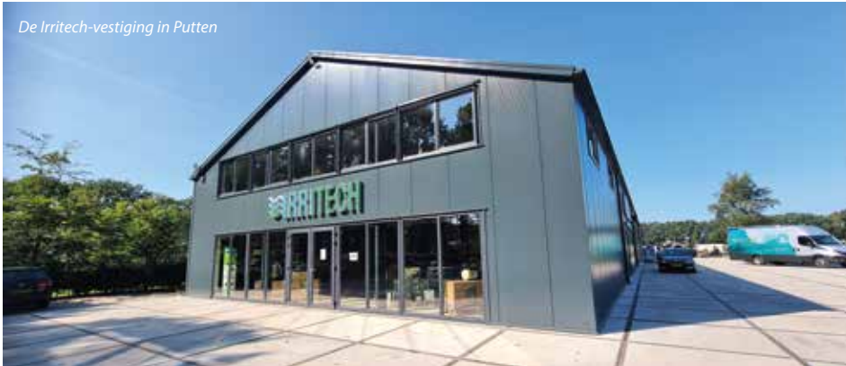
De Irritech-vestiging in Putten

de vorming van ammonium.' Zijn boodschap: het in balans brengen van vijverwater moet in deze volgorde, waarbij gestreefd wordt naar de vermelde waarden: KH-waarde: 6+, GH-waarde: 8-11, fosfaat: 0-1 mg/l, ammoniak: 0, nitriet: 0, koper: 0, chloor: 0.