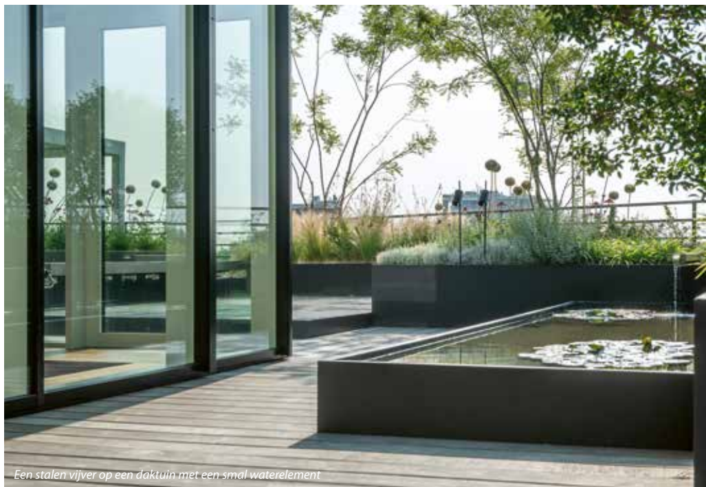
Een stalen vijver op een daktuin met een smal waterelement