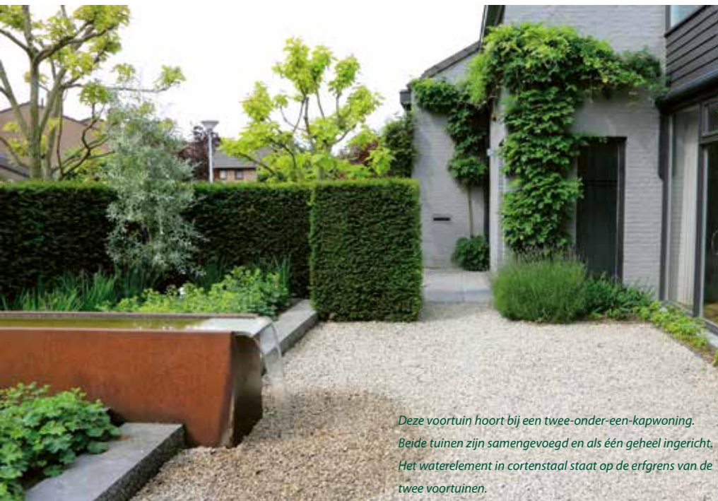
Deze voortuin hoort bij een twee-onder-een-kapwoning. Beide tuinen zijn samengevoegd en als één geheel ingericht. Het waterelement in cortenstaal staat op de erfgrans van de twee voortuinen.