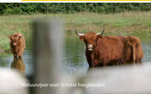
Natuurvijver voor Schotse hooglanders