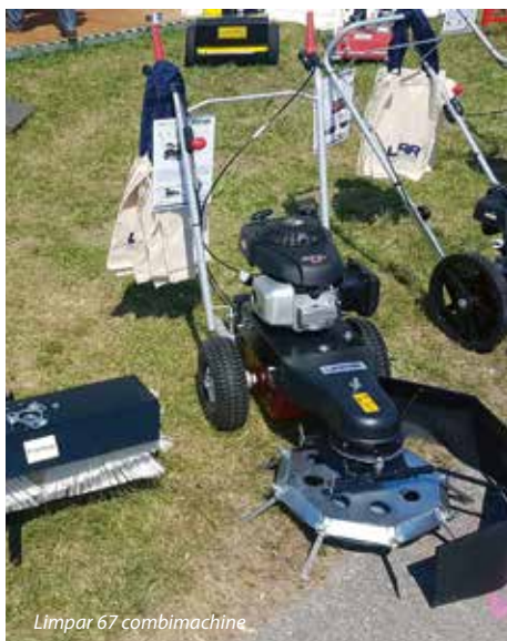
Limpar 67 combimachine

De hovenier kan met dezelfde machine onkruid borstelen en later met een veegborstel eronder de boel wegvegen