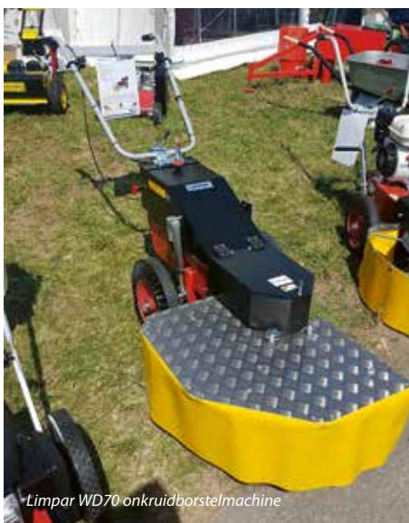
Limpar WD70 onkruidborstelmachine

www.Limpar.nl www.knopert.nl www.demopark.de