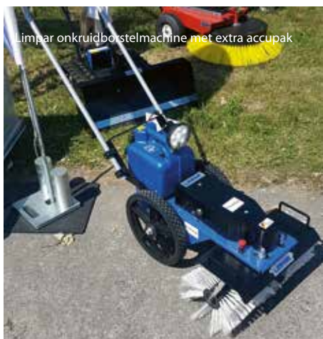
Limpar onkruidborstelmachine met extra accupak