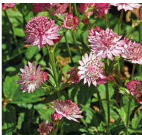
2 Astrantia major 'Roma' (Zeeuws knoopje)

'Ja, Achillea 'Terra Cotta'. Wat kan ik erover zeggen? Ik hou ervan. Ik hou ook van terracotta potten, van de natuurlijke kleuren. Het is een prachtige plant, die heel mooi past in een cottagetuin, zo'n Engelse tuin. De plant wordt 60 tot 70 cm hoog en heeft graag een zonnige standplaats op niet al te schrale, maar ook niet al te voedselrijke grond en een droge bodem. De terracotta kleur is bijzonder. Daarbij bloeit deze soort van de vroege zomer tot de herfst. Het is een interessante plant voor bepaalde soorten vlinders en bijen. Hij is winterhard en vraagt weinig onderhoud.'