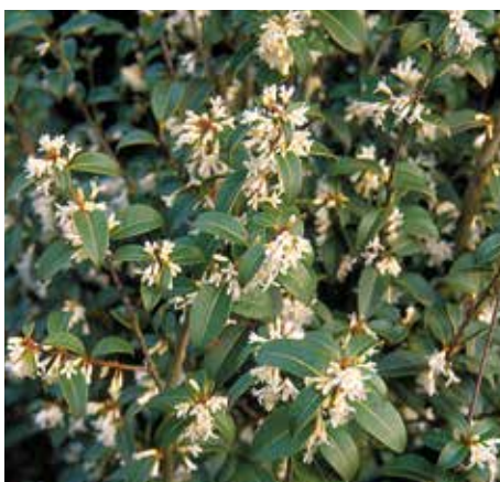
5 Osmanthus burkwoodii (schijnhulst)

'Deze plant bloeit volop in het voorjaar met donkerroze en rozerode bloemen. Hij is in meerdere vormen te verkrijgen: als struik, halfstam en hoogstam. Het blad verkleurt in de herfst naar heldergeel. Het is een kleine soort judasboom. Ook deze plant staat graag in de volle zon.'