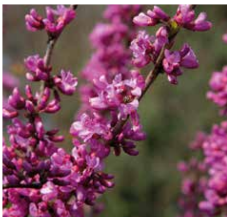
4 Cercis chinensis 'Avondale' (Chinese judasboom)

'Deze plant bloeit volop in het voorjaar met donkerroze en rozerode bloemen. Hij is in meerdere vormen te verkrijgen: als struik, halfstam en hoogstam. Het blad verkleurt in de herfst naar heldergeel. Het is een kleine soort judasboom. Ook deze plant staat graag in de volle zon.'