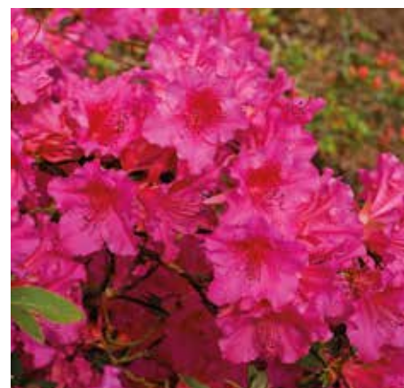
6 Rhododendron (AJ) 'Purple Splendor'

'Ook dit is een mooie plant, bladhoudend, met witte bloemen die heerlijk zoet geuren. Het is een wintergroene heester die tot 250 cm hoog kan worden. Toch hoeft hij slechts eenmaal per jaar gesnoeid te worden. Deze plant wordt ook gebruikt om "wolken" mee te maken, of mooie, bloeiende haagjes. In de tuin kan hij wel wat droogte hebben, maar het liefst heeft hij z'n wortels in vocht-houdende grond. Standplaats: bij voorkeur in de zon of halfschaduw. In mijn eigen tuin zit er elk jaar een vogelnestje in deze struik.'