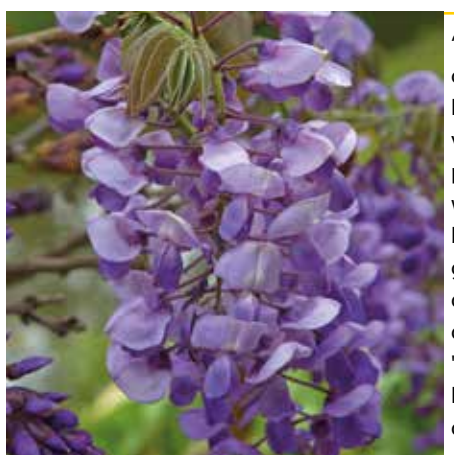
8 Wisteria brachybotrys 'Okayama'

'De naam zegt het al: dit zijn rozen die muteren. Rosa mutabilis is een Chinese roos waarvan de bloemen van kleur veranderen. Ze beginnen zachtgeel, worden dan roze en later dieprood. Deze roos wordt 120-150 cm hoog en bloeit de hele zomer, van mei tot september. De plant groeit het beste op een open plaats in de volle zon en de bloemen met de verschillende kleurschakeringen zijn prachtig. We hebben slechts enkele klanten die deze meenemen. Deze plant staat naast mijn voordeur en wanneer hij in bloei staat, bellen mensen soms aan om te vragen wat het is. Heel bijzonder.'