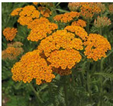
1 Achillea 'Terracotta' (duizendblad)

'Ja, Achillea 'Terra Cotta'. Wat kan ik erover zeggen? Ik hou ervan. Ik hou ook van terracotta potten, van de natuurlijke kleuren. Het is een prachtige plant, die heel mooi past in een cottagetuin, zo'n Engelse tuin. De plant wordt 60 tot 70 cm hoog en heeft graag een zonnige standplaats op niet al te schrale, maar ook niet al te voedselrijke grond en een droge bodem. De terracotta kleur is bijzonder. Daarbij bloeit deze soort van de vroege zomer tot de herfst. Het is een interessante plant voor bepaalde soorten vlinders en bijen. Hij is winterhard en vraagt weinig onderhoud.'