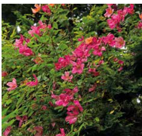
7 Rosa mutabilis

'Dit is een Japanse azalea met dubbele bloemen. De plant bloeit in mei, maar ook als hij niet bloeit, is het een heel mooie plant. De plant kan 1 m hoog worden en houdt van standplaats in de halfschaduw. Leuk om te vermelden: wij zijn hoofdleverancier van Artis; daar wordt een enorme wolkenpartij gemaakt van deze Rhododendron 'Purple Splendor'. Daar staan acht hoogtematen van deze plant; dat geeft straks een heel mooi effect.'