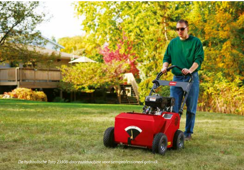
De hydraulische Toro 23508-doorzaaimachine voor semiprofessioneel gebruik

Dit voorjaar introduceert Eliet naast de DZC600 een gloednieuwe DZC450. Deze versie is net iets kleiner en compacter. Dat maakt hem geschikt om te gebruiken in particuliere tuinen. Volgens importeur Stierman De Leeuw heeft de werking van deze 45 cm brede doorzaaiër veel weg van die van de DZC600, waarop hij gebaseerd is. Toch is het geen 100 procent kopie. Volgens de woordvoerder van de importeur zijn op het vlak van werkcomfort, instelling en onderhoud bij de DZC450 heel wat punten doorontwikkeld. Ook anders is dat de DZC450 in het uitvoerkanaal een sneldraaiend rubberen schoepenrad heeft gekregen. Dit heeft een belangrijke functie: 'Het versnelt de projectieaarde die vrijkomt bij het snijden van de groeven. Die raakt daardoor verpulverd en komt nog gelijkmatiger uitgestrooid op het zaaibed terecht', vertelt de woordvoerder. 'Dat geeft de machine een optimaal topdress-effect. Dit schoepensysteem is volledig onderhoudsvrij en verhoogt de bedrijfszekerheid van de machine, wat hem ook inzetbaar maakt in de verhuur.'