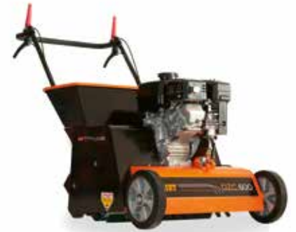
De Eliet DZC600