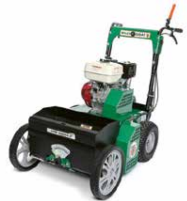
Billy Goat OS 901 SP

Importeur Lankhaar Techniek levert van het merk Billy Goat onder meer de OS901 SPH, een professionele doorzaaimachine die ontworpen is om gazons er weer stralend uit te laten zien. De machine heeft een automatische start- en stopstand voor de zaaibakopening; een messenrondsel volgt nauwkeurig de contouren van het gazon. Een Honda GX 270-motor met dubbele V-snaar zorgt daarbij voor de aandrijving. De machine beweegt zich hydrostatisch voort met een snelkeuzesysteem van voor- naar achteruit en een simpele vrijstand voor transport. Deze machine is dus op grote en kleine gazons bruikbaar, omdat hij heel manoeuvreerbaar is. De diepte is eenvoudig en nauwkeurig in te stellen met een roermechanisme. De nieuwste versie heeft een pedaal waarmee de gebruiker de machine uit het werk kan zetten. Daardoor worden de elf messen aan de vaste as gespaard. Aanvankelijk hadden de vaste messen acht tips, maar volgens het nieuwste ontwerp zijn er nu ook messen met drie tips. Volgens informatie van de fabrikant is er ook een kit beschikbaar