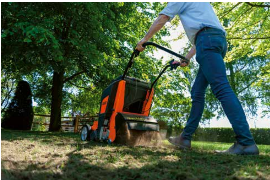
De nieuwe DZC 450 van Eliet strooit de projectieaarde nog mooier uit op het zaai bed.