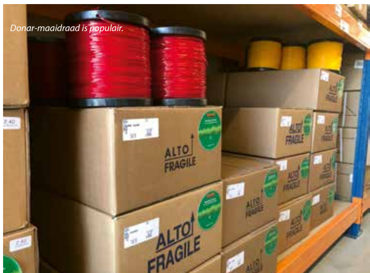
Donar-maaidraad is populair.