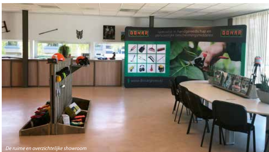
De ruime en overzichtelijke showroom