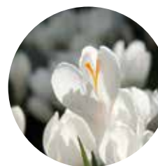
Crocus vernus 'Jeanne d'Arc'

kleine en geurende bloem. De naam 'bostulp' is verwarrend, want dit tulpje staat het liefst in de zon, in een wilde bloemenweide of in een natuurlijke, zonnige border. Na een paar jaar de hele plant opnemen en opnieuw planten; dan zal deze blijven bloeien.