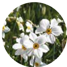
Narcissus poeticus var. recurvus

vroegbloeiende soorten. Een altijd winnende combinatie is die met de mauve tulp 'Blue Diamond' en de dubbelbloemige tulp 'Black Hero'. Ook mooi met Camassia . Ook met koraal-, zalm- en abrikooskleurige soorten vormen deze zwarte tulpen een geweldige combinatie, evenals of met bronskleurige Euphorbia griffithii .