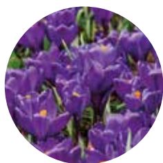
Crocus vernus 'Flower Record'

Een grootbloemige krokus. Krokussen houden van een zonnige standplaats, dus fleur de saaie border in het vroege voorjaar ermee