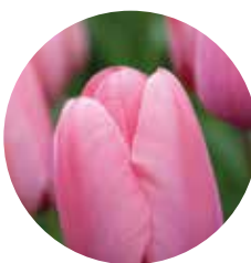
Tulipa 'Pink Impression'

in knop als volledig als een ster opengebloeid een sieraad in elke tuin. Geef haar een plek in voedzame grond op een niet te vochtig gazon of vooraan in de border. Kan ook in potten met bijvoorbeeld witte druifjes. Prachtig.