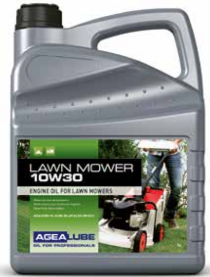
Agealube Lawn Mower