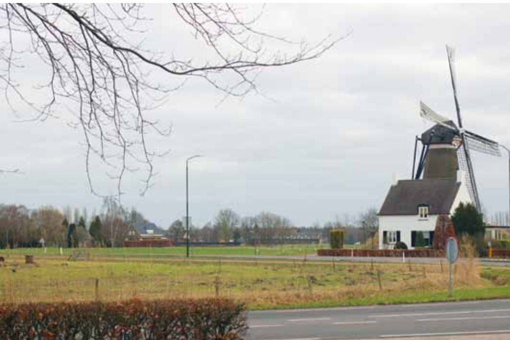
Aan de overkant van de weg staat de windmolen de Roosdonck van Nuenen, met daarachter de oude arbeiderswoning waar schilder Van Gogh ooit zijn 'aardappeleters' aantrof en op het doek vereeuwigde.