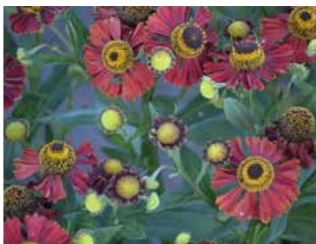
10. Helenium 'Potters Wheel'

Nog een cultivar met koper in de naam. Het is trouwens opvallend hoeveel cultivars een Duitse naam dragen; dat was zelfs de schrijver van een Amerikaans vasteplantenboek opgevallen. Met een hoogte van 1 meter hoorde de plant bij zijn introductie bij de lagere soorten. Inmiddels zijn er dus veel lagere cultivars op de markt. De donkere bronsbruine kleur is opvallend en het randje meeldraden geeft een subtiel accent.