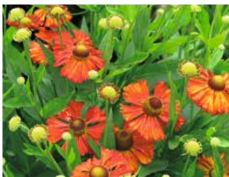
7. Helenium 'Kupferziegel'

Het bloemhart van 'Kupferziegel' begint groen en wordt allengs bruiner. De bloembladen zijn licht bruinrood, net iets frisser dan die van 'Moerheim Beauty'. Ondanks zijn lengte van 120 tot 140 centimeter blijft de plant goed overeind staan. Ook dit is weer een kanjer die in de prijzen is gevallen, want de vrij grote bloemen en rijke bloei zorgen voor één grote bloemenzee.