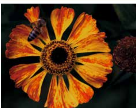
5. Helenium 'Sahin's Early Flowerer'

'Short and Sassy' heeft nóg meer oranje in de bloem en is bovendien compact groeiend, wat hem interessant maakt om te gebruiken. Meestal staat Helenium achter in de border, maar deze kan als randbeplanting gebruikt worden, want hij wordt maar 40 centimeter hoog. Hij bloeit van juli tot en met september. Hij heeft ooit een zilveren medaille gewonnen op Plantarium, omdat hij echt vernieuwend is in het sortiment.