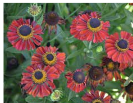
9. Helenium 'Kupferzwerg'

Door de vorm van de bloemblaadjes is deze plant zeer herkenbaar. Hij is ooit gevonden door een 'Loysder' (Leusdense) docent plantenkennis. De omgevouwen kroonblaadjes lijken op een molenwiek, vandaar de naam. Het is een stevig rechtopstaande plant, die daarom is bekroond met drie sterren. Hij wordt rond 1 meter hoog en bloeit in juli en augustus, met een uitloop naar september.