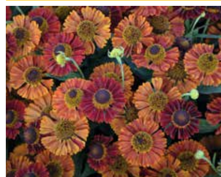
6. Helenium 'Salsa' (pbr)

Dit is misschien wel mijn favoriet. 'Sahin's Early Flowerer' bloeit blij oranje-roestkleurig gemêleerd, staat stevig op de steel en is altijd een succes. Hoeveel Helenium -cultivars je ook naast elkaar zet, deze haalt je er altijd tussenuit. Hij haalt makkelijk 1 meter hoogte en bloeit van juli tot ver in september. De grote bloemen leverden in Duitsland drie sterren op.