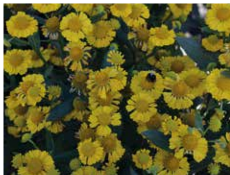
1. Helenium 'Kanaria'

Deze top 10 is gebaseerd op ervaring, een keuringsrapport van de Duitse vasteplantenvereniging en het oordeel van Kwekerij Jacobs, en daarnaast heb ik gekeken naar verschillende hoogtes en bloemvormen. Van alles wat, dus.