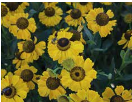
2. Helenium 'El Dorado'

Dit is een al wat oudere cultivar, maar hij blijft onovertroffen. De heldergele kleur – je kunt wel zeggen kanariegeel – mag weer gebruikt worden in de border. Het hart, dat bij veel soorten bruin is, blijft bij deze plant juist geel tijdens de bloei. De hoogte is rond 1 meter. De bloembladen sluiten soms wel en soms niet tijdens de bloei, die duurt van eind juli tot ver in augustus. Het blad is vrij groot en gezond groen.