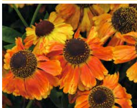
4. Helenium 'Short 'n' Sassy' PBR EU 43299

De bloemblaadjes van 'Rauchtupas' staan los van elkaar en bevatten een vleug oranje. Dat komt doordat de bloemblaadjes hol staan en de achterkant oranje is – een leuke nuance. Hij wordt bijna 1,50 meter hoog, maar blijft over het algemeen toch goed rechtop staan. Ook dit is weer een driesterrenwinnaar. Een Rauchtupas is overigens een bruin gekleurde edelsteen.