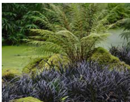
8 Ophiopogon planiscapus 'Niger'

Heuchera hoort zeker in deze top 10. Het is de plant bij uitstek om zelfs jaarrond kleur in de tuin te houden. Hij is in vele tinten te verkrijgen. 'Midnight Summer' valt op door hier en daar een spettertje roze op het blad; 'Obsidion' is en blijft ondanks allerlei nieuwe introducties één van de donkerbladigste van allemaal. 'Black Beauty' met zijn gegolfde bladrand doet ook nog altijd mee, en zo kun je er nog een aantal noemen.