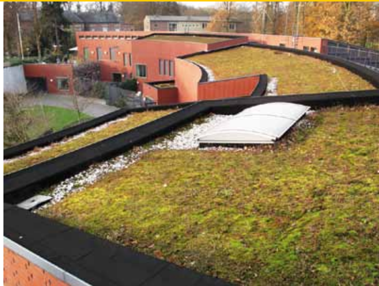
Geen onderhoud geeft verarming van de sedumgroei; door de verkeerde laagopbouw vindt tegelijkertijd verrijking van mossen plaats.