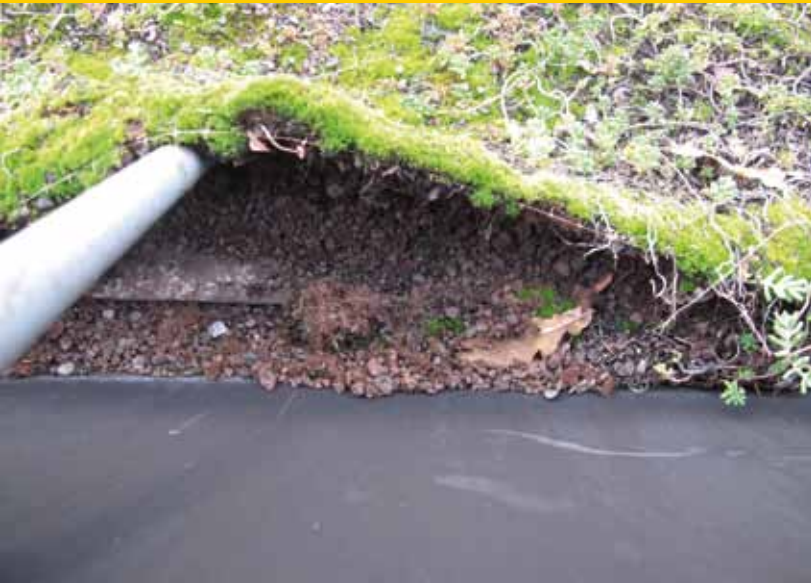
Verkeerde dakopbouw; recycled doek en dunne substraatlaag houden vocht vast met als gevolg sterke mosvorming en overdreven onderhoud.